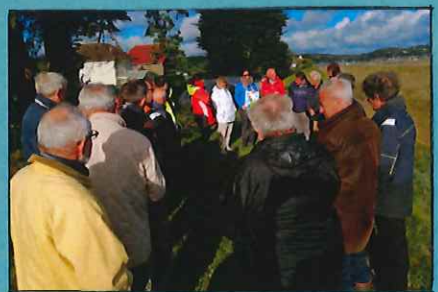
Photographie Eau'tour du SAGE saison 2

Enfin, une session restreinte d'Eau'tour du SAGE aura lieu sur la thématique de la culture du risque, en rapport avec le Programme d'Actions de Prévention des Inondations (PAPI). Elle réunira les élus du PAPI et du SAGE. ■